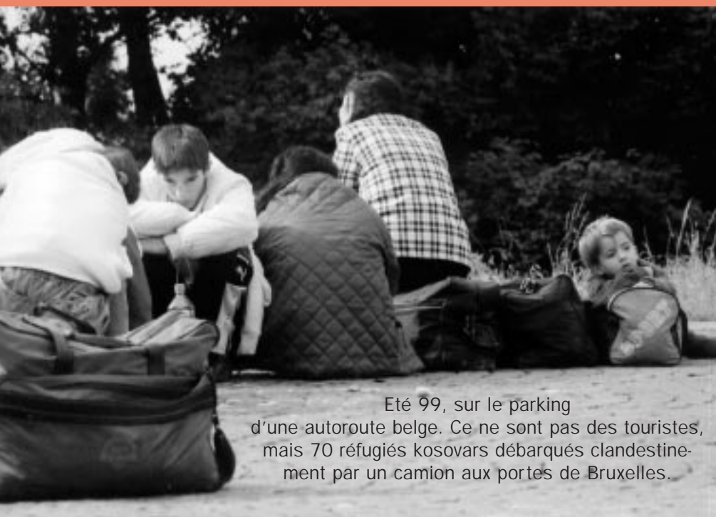
Été 99, sur le parking d'une autoroute belge. Ce ne sont pas des touristes, mais 70 réfugiés kosovars débarqués clandestinement par un camion aux portés de Bruxelles.